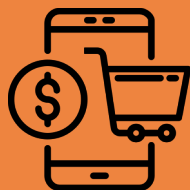
E-Commerce Scam (Variants)