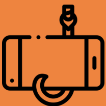
Penipuan Pancingan Data (Bank)