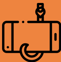
钓鱼骗局 (社交媒体)